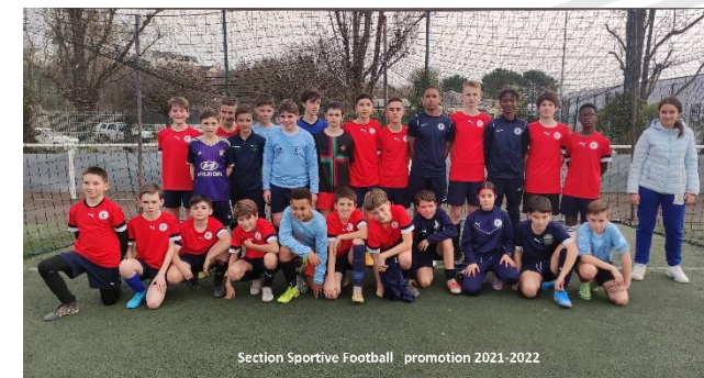
Section Sportive Football promotion 2021-2022

⇒ Mise à disposition d'éducateur(s) ⇒ Mise à disposition du matériel pédagogique