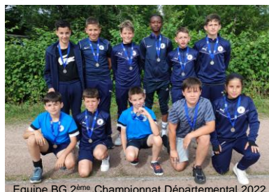
Equipe BG 2 ème Championnat Départemental 2022

Un élève entrant en section sportive scolaire aura donc pendant l'intégralité de sa scolarité un aménagement de l'emploi du temps permettant de suivre l'ensemble du programme et des apprentissages : scolaires et football.