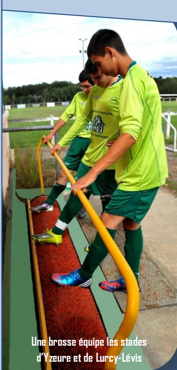
Une brosse équipe les stades d'Yzeure et de Lurcy-Lévis