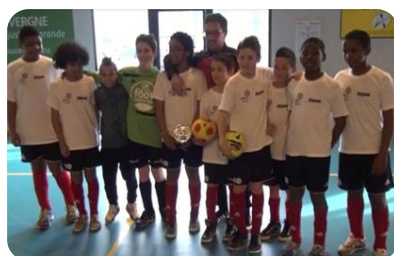
U13 2 ème -3 ème division AS Prémilhat