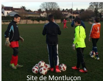
Site de Montluçon