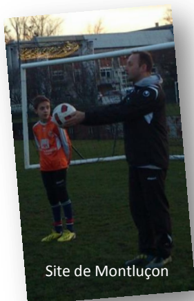
Site de Montluçon