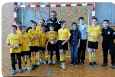
U11 Championnat SC Gannat