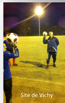
Site de Vichy