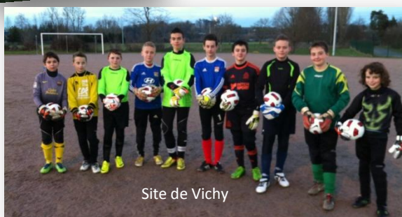
Site de Vichy