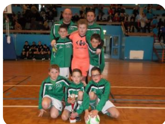
U11 Challenge JS Neuvy-Coulandon