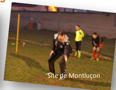
Site de Montluçon