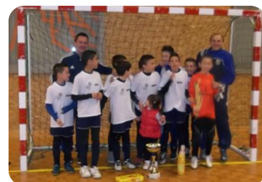
U11 Excellence IEF Montluçon