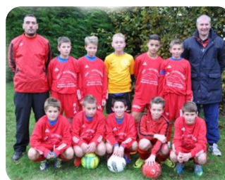
U13 Excellence - 1 ère div. Sud Allier Foot