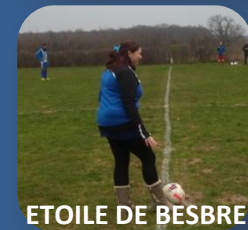
ETOILE DE BESBRE