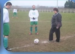
US Saint-Victor La Trésorière du club depuis 30 ans