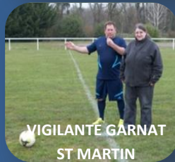
VIGILANTE GARNAT ST MARTIN