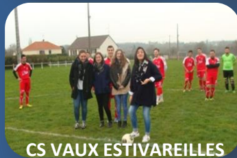
CS VAUX ESTIVAREILLES