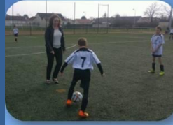
CS Bessay/Allier Maman et supportrice de l'Equipe 2 des U11 de l'Entente Bessay/Allier- Neuilly-le-Réal

Opération « Coup d'envoi donné par une femme » Les 3 clubs lauréats