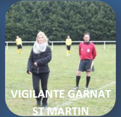
VIGILANTE GARNAT ST MARTIN