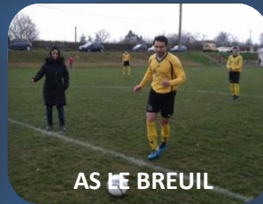
AS LE BREUIL