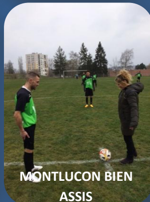
MONTLUCON BIEN ASSIS